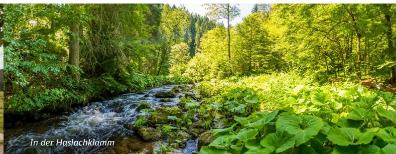
In der Haslachklamm